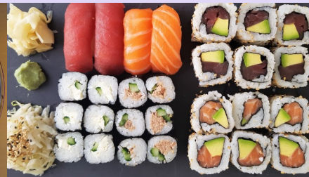
* Plateau Mix (28 pièces)