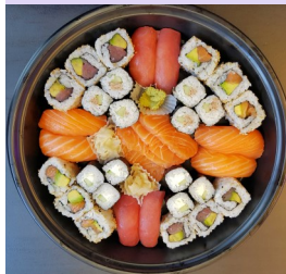
* Plateau duo (36 pièces)