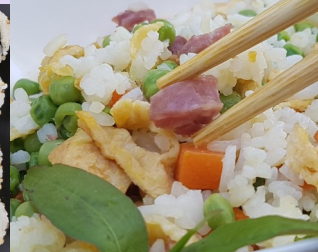
* Riz Cantonais spécial So Tchi