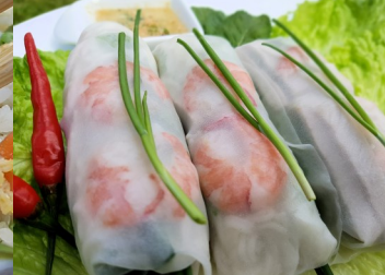
* Rouleaux de printemps