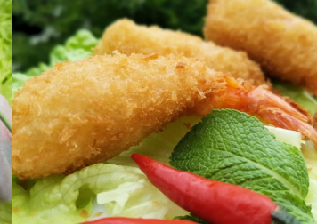
* Beignets de crevettes